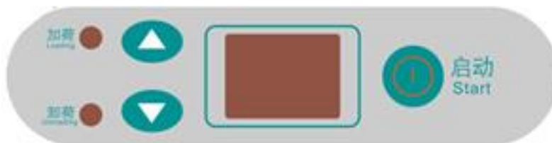
Рис 2 Панель управления автоматического твердомера по Роквеллу